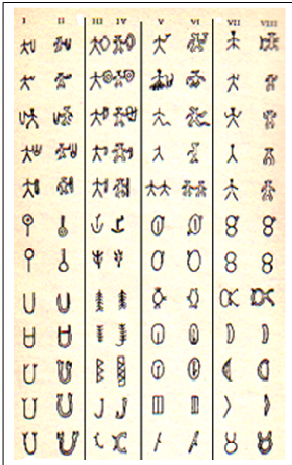
SOLDA: Rongorongo hece işaretleri

Paskalya adasına has bir de özel yazı tarzı bulunmaktadır. Bu yazıya türüne Rongorongo denmektedir. Altta bu hece yazısının işaretlerini görmekteyiz. Rongorongo hece yazısının 48 işareti bulunmaktadır. Bu işaretlerin hangi hecelere karşılık geldikleri çözülmüş değildir. Ancak benzerlik içeren guruplar saptanmış olup işaretler arasındaki yakın ilişkiler üzerinde çalışmalar sürmektedir.