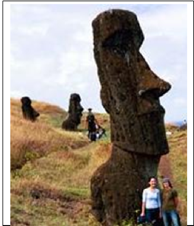
ALTTA: Adadaki heykellerin çoğu birkaç insan boyunda oldukları görülmektedir.