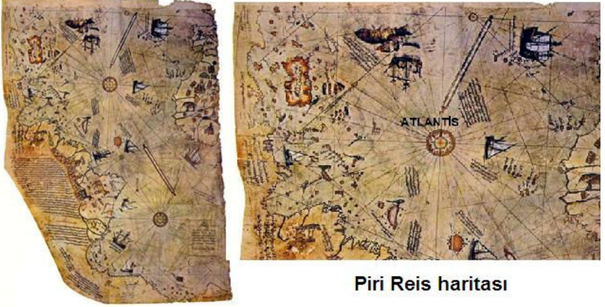
Piri Reis haritası

48 sayılı Atlantis Hakkında başlıklı yazımda Atlantis adasının Atlas okyanusunun orta bölgelerinde olabileceğinden ve Teozofi derneğinin bir haritada bu adayı göstermiş olduğundan söz ettim. Ne kadar ilginçtir ki, Piri Reis haritasının merkez noktası Atlantis adasının tahmini yeri ile mükemmel çakışıyor. Altta bu harita görülüyor.