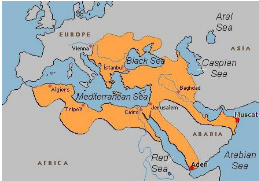
1500 lü yılların sonlarında Osmanlı İmparatorluğu

Piri Reis (doğumu tahminen 1465 - vefatı 1553) hem Osmanlı deniz amirali hem de haritacı olarak ün salmıştır. Haritaların çoğunu 1513 yılında çizmiş ve Kitab-ı Bahriye adlı eserinde toplamıştır. 1516'dan itibaren denizlerde çeşitli savaşlara katılmış, Mısır'ın fethinde, Rodos adasının kuşatmasında, Yemen'deki Aden ve Oman'daki Muscat şehirlerinin alınışında başrol oynamıştır. Altta 16. yüzyıl sonlarında Osmanlı İmparatorluğunun hudutları görülüyor.