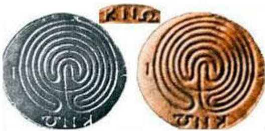
Kadim Girit Paraları

Üstte solda görülen Girit adasının Yunan dilindeki adı Krete olup, kadim Ön-Türk kökenli OK halkının yerleşim yerlerinden biridir (2). Bu adın üç adet kök sözcüğün bitişiminden oluştuğu kanısındayım. OK-UR-ET heceleri anlamlı birer Türkçe sözcüktürler. Ur-Et sözcükleri "yerleştir" anlamlarını içerdiğinden üçü birlikte Oklaştır , yani "Ok halkının toprağı yap" anlamını içeriyor. Nitekim Knossos şehir adını aynı şekilde OK-ON-OS-OS şeklinde ayırırsak "Evrensel Oklarıdır" anlamı belirir. ON kök sözcüğü Ön-Türk dilinde "çevre, maddi alan" anlamını taşıdığından OK-ON "evrensel OK halkı" demek olur. OS takıları ise aidiyet anlamında olup birincisi "-ın" ikincisi "-dır" yerindedir.