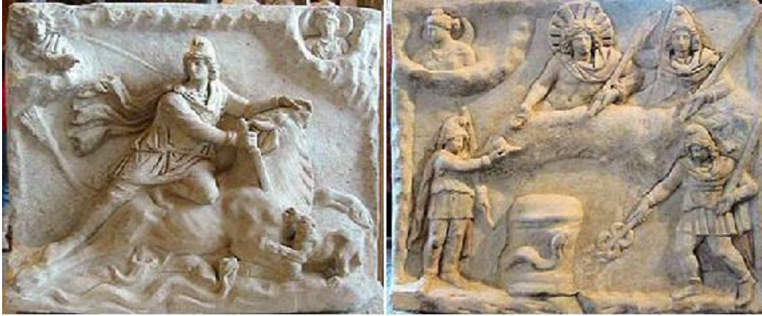
Boğayı öldüren Mitra