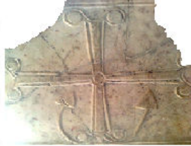
Aziz Nikola Kilisesinden