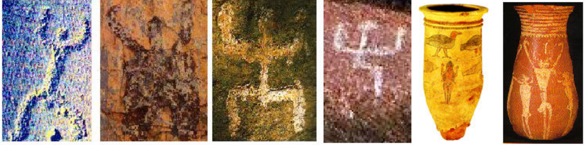
Orta Asya kaya resimleri

Demek ki M.Ö. 1,500 yıllarından dahi önce Ön-Türkler Mezopotamya bölgesinden batıya doğru yayılmışlar ve Mısır medeniyetinin kuruluşuna kaynaklık etmişler. Sfenks üzerindeki bir şekli hem Orta Asya bölgesinde hem de Mısır öncesi kültürde buluyoruz. Altta bu örnekler görülüyor. Bu şekil Gök Tengri'ye yakaran insanı düşündürüyor.