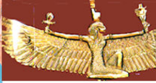
Kuş Ülkesinde bulunmuş altın göğüslük