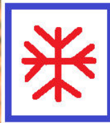
OKH ve TENGRİ damgası