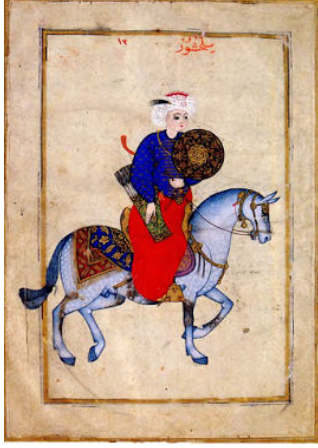
Türk Atlarının Kuyruk Düğümü

Pazırık halısının bir Türk eseri olduğunu kanıtlayan birçok gösterge vardır. Üstte görülen halının çevresinde peş-peşe dizilmiş atlılar görüyoruz. Atların tahta eyeri yoktur. Eyer görevini süslü bir halı görmektedir. Atların kuyrukları ise düğümlüdür. Bu özellik kesinlikle Türklere ait bir gelenektir. Altta solda atının kuyruğunu bağlamış bir Türk savaşçısının minyatür resmini ve sağda Pazırık halısındaki bir süvariye görüyoruz. Atın kuyruğu bağlı olduğu halıda özellikle belirtilmiştir. Hatta düğümü sağlayan ip bile belirgindir.