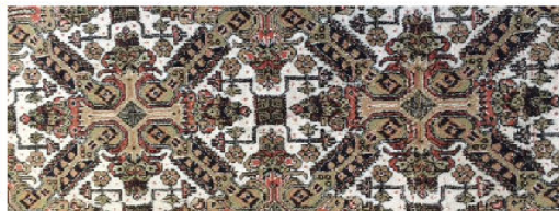
Kayseri halısındaki motif simgeler