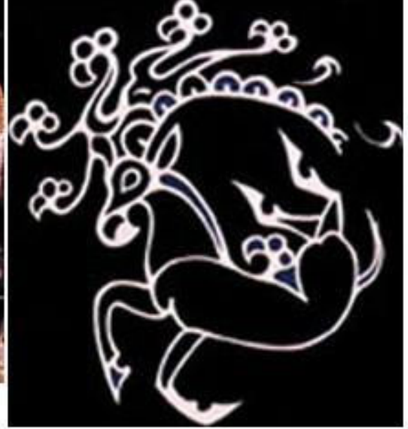
Dövme görüntüsü ve çizimi